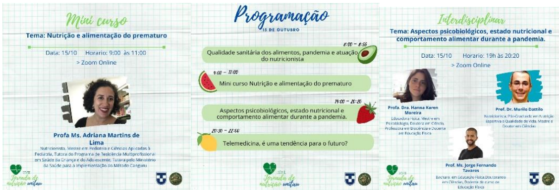
Foto da Jornada de Nutrição. Taubaté, 2020