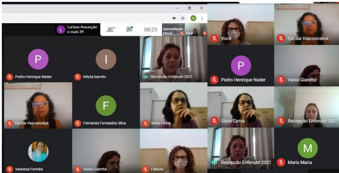
Foto da tela da recepção virtual dos ingressantes do curso de nutrição, Taubaté, 2020.