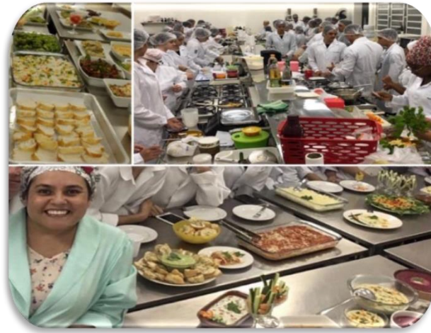
Figura 1. Foto aula prática disciplina Introdução à Gastronomia no LND. Taubaté, 2019