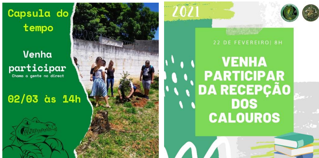
Folder sobre atividade presencial com calouros da Nutrição. Taubaté, 2020