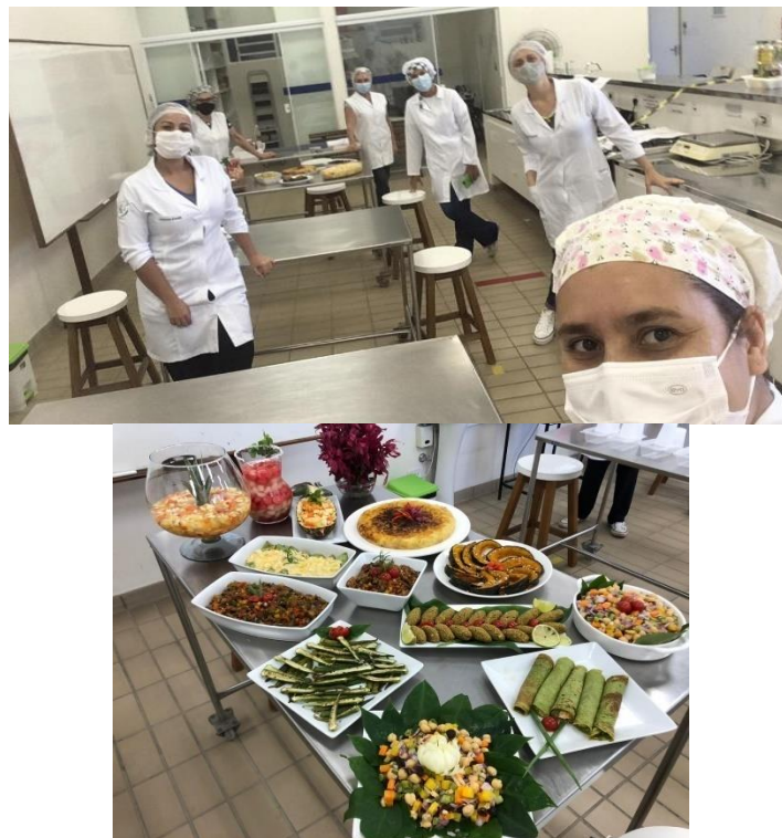
Figura 2. Fotos de aula prática de Introdução à gastronomia no LND. Taubaté, 2020