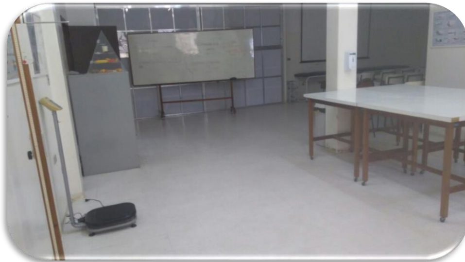
Figura 3. Foto do Laboratório de Avaliação Nutricional. Taubaté, 2019

Equipamentos: 2 adipômetros científicos Lange ® , 2 adipômetros clínicos Sanny ® , 19 adipômetros clínicos Cescorf ® , 19 fitas antropométricas Cescorf ® , 1 adipômetro científico Harpenden Skinfold Caliper ® , 2 analisadores de gordura corporal Teck Line ® , 1 monitor de composição corporal Biodynamics ® BIA 310 E, 1 monitor para controle de gordura corporal OMRON ® , 2 balanças elétricas adulto portátil Marte ® , 1 balança digital de plataforma Filizola ® , 2 balanças eletrônicas pediátricas BP Baby Welmy ® , 1 balança eletrônica pediátrica BP Baby Filizola ® , 4 estadiômetros adulto Altura Exata ® , 1 estadiômetro adulto Cardiomed ® , 3 estadiômetros recém-nascido Sanny ® , 2 estadiômetros recém-nascido dobráveis Sanny ® .