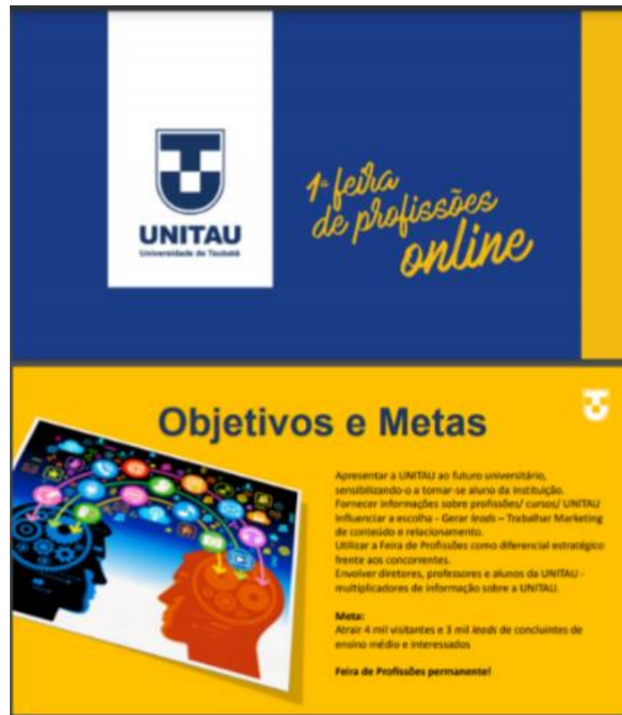
Folder Feira das profissões. Taubaté, 2020