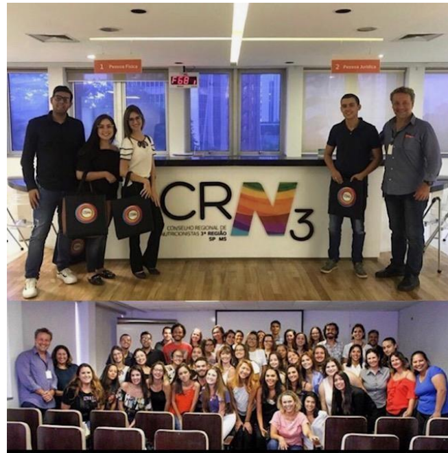
Foto do Evento CRN. São Paulo, 2019