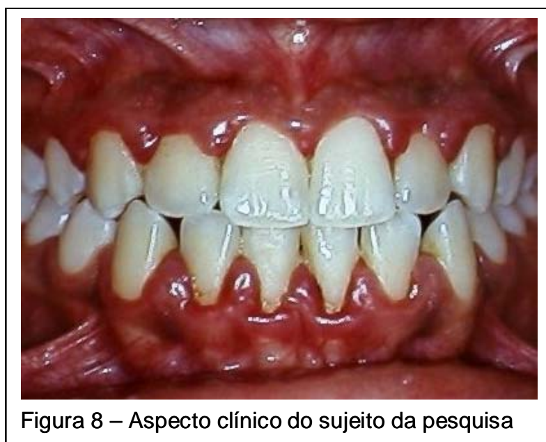
Figura 9 – Exemplo de figura

As figuras deverão ter significado próprio, dispensando consultas ao texto. Ao longo do Texto, as imagens deverão ser mencionadas pela palavra Figura com seu respectivo número, por exemplo: