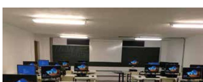
Investimentos em laboratórios para melhoria da qualidade de ensino