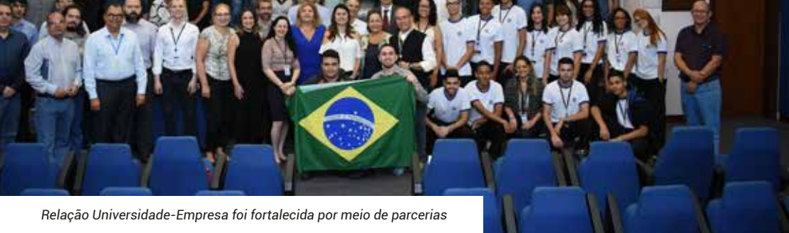
Relação Universidade-Empresa foi fortalecida por meio de parcerias

Formar profissionais cidadãos e empreendedores é a missão da nossa Universidade. A nova gestão incentivou a criação de novos grupos de estudo. Agora, além do Na Ponta da Língua (Grupo de Estudos em Língua Portuguesa | GELP) , nossos alunos contam também com o Na Ponta do Lápis (Grupo de Estudos de Matemática e Física | Gemaf) e com o Provando o Ponto (Centro de Estudos Jurídicos | Cejur) .