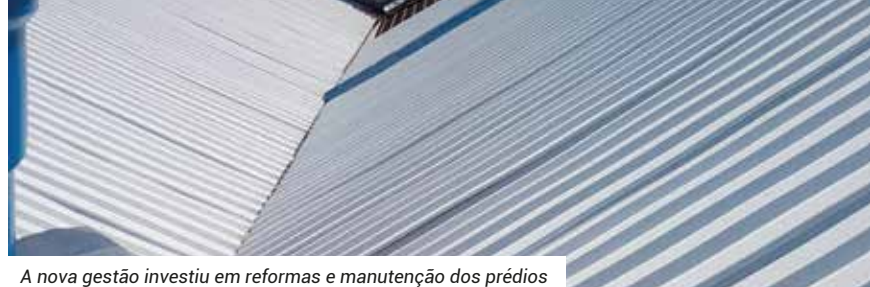
A nova gestão investiu em reformas e manutenção dos prédios

A rotina das secretarias e dos setores foi revista. A iniciativa tornou os atendimentos mais eficientes e padronizados .