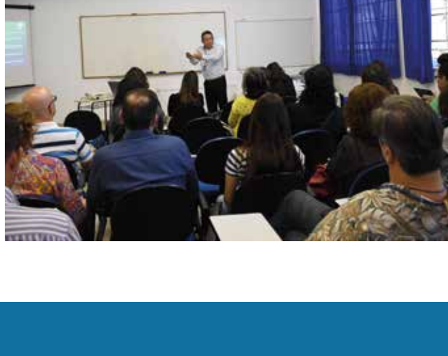
Empreendedorismo foi o tema da última oficina do semestre

Nesta nova gestão, o Comitê de Ética em Pesquisa criou uma plataforma com um tutorial para auxiliar alunos e professores na submissão dos trabalhos na Plataforma Brasil .