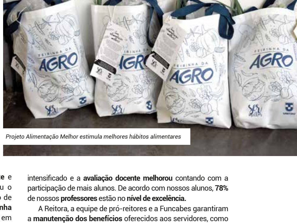
Projeto Alimentação Melhor estimula melhores hábitos alimentares

Reconhecer e incentivar as boas práticas pedagógicas também foi uma das prioridades da nova gestão. Ao longo deste um ano, o trabalho da Comissão Própria de Avaliação (CPA) foi