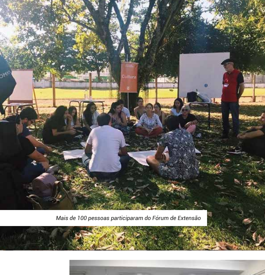
Mais de 100 pessoas participaram do Fórum de Extensão

Em 2019, sete alunos irão estudar no semestre em uma universidade do exterior . A nova gestão manteve os programas de intercâmbio e trabalha para novas parcerias que fomentem a internacionalização .