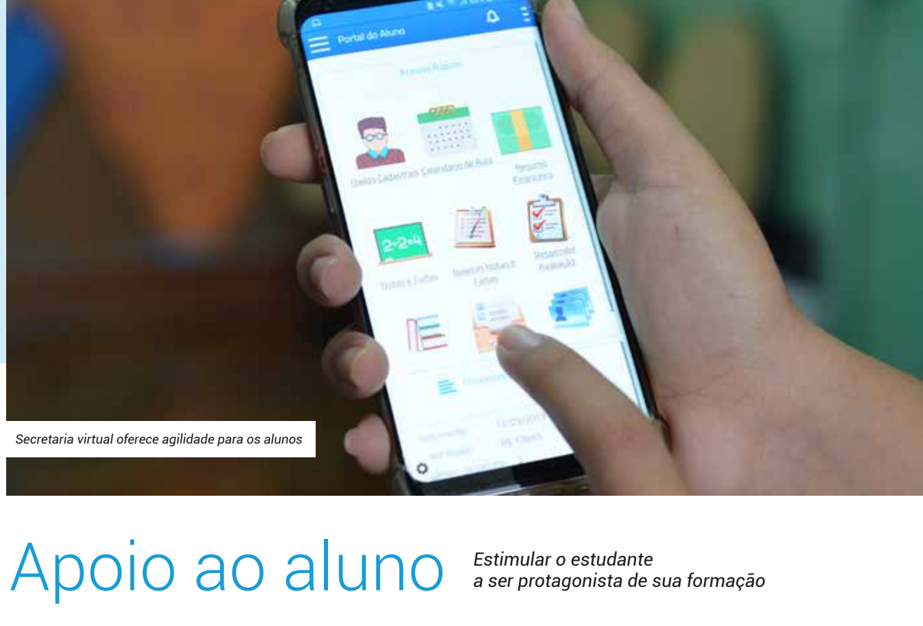
Secretaria virtual oferece agilidade para os alunos

Desde o início de 2019, o Colégio UNITAU está sob nova direção com foco no crescimento do número de alunos e na qualidade de ensino desde os primeiros anos.