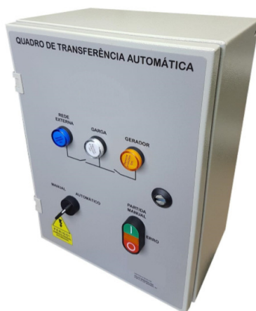
Imagem 01: Ilustração do Quadro de Transferência Automática – QTA

(manutenção nas cabines primárias, por exemplo). O QTA deverá ser fornecido em chapa de aço de alta resistência, conforme normas específicas. Deverá apresentar minimamente as seguintes funções externas: 1 controlador do gerador, 1 chave de transferência automática de 220V/125 A, 3 lâmpadas de status de rede e 1 lâmpada de erro ou falha de sistema (acende sempre que acontecer alguma falha do sistema, tais como: falta de combustível, 3 tentativas de partida sem sucesso, sobrecarga do sistema, desligamento repentino do gerador), 1 botão duplo liga/desliga (para acionamento do gerador em modo manual/teste), 1 chave seletora 2 posições manual/automático.