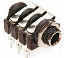
TOMADA P2 STEREO