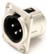
CONECTOR XLR MACHO, CABO