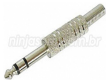
JACK P2 STEREO DOURADO PARA CABO